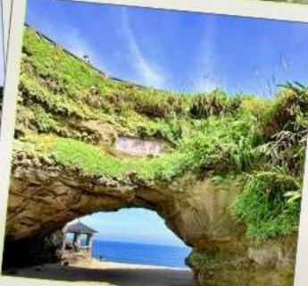
ถ้ำสือเหมิน