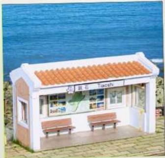
Tiaoshi Bus Station