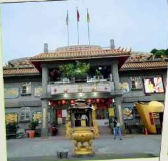
วัดจินชาน (โชคลาก)