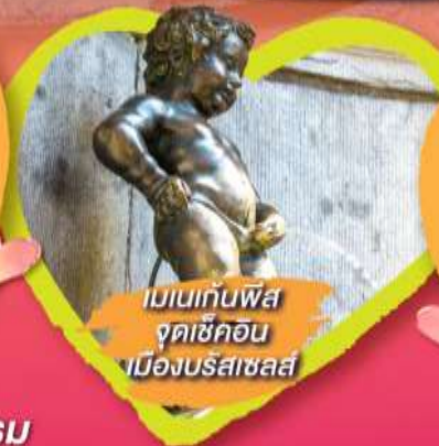
เมเนเกินฟิส จุดเช็คอิน เมืองบรัสเซลส์