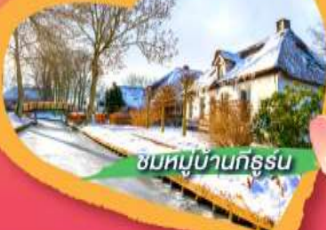
ชมหมู่บ้านกุรูน