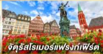
จัตุรัสโรเมอร์ฟรังก์เฟิร์ต