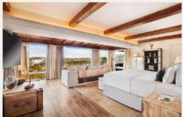
Hotel das Cataratas, A Belmond Hotel