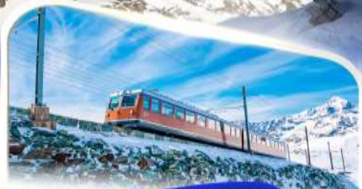
ขึ้นรถไฟฟ้าน้ำแข็งก่อนนอน