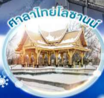
ศาลาไทยโบราณ