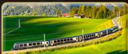
นั่งรถไฟสายโรแมนติก 2 สาย Golden Pass / Luzern Interlaken Express

📅 เดินทาง: 5-12 เม.ย. | 31 พ.ค.-7 มิ.ย. 69