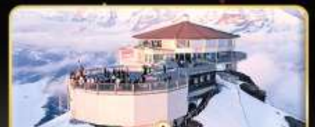
ทานอาหารที่ Piz Gloria ภัตตาคารที่หมุนได้ 360 องศา