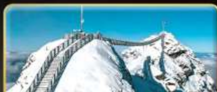
พีชิต 3 ยอดเขาดัง Rigi / Schilthorn / Glacier 3000