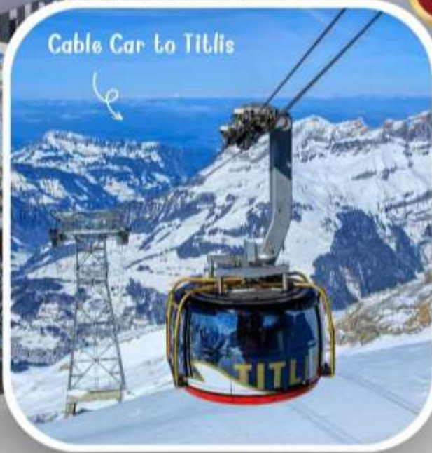
Cable Car to Titlis