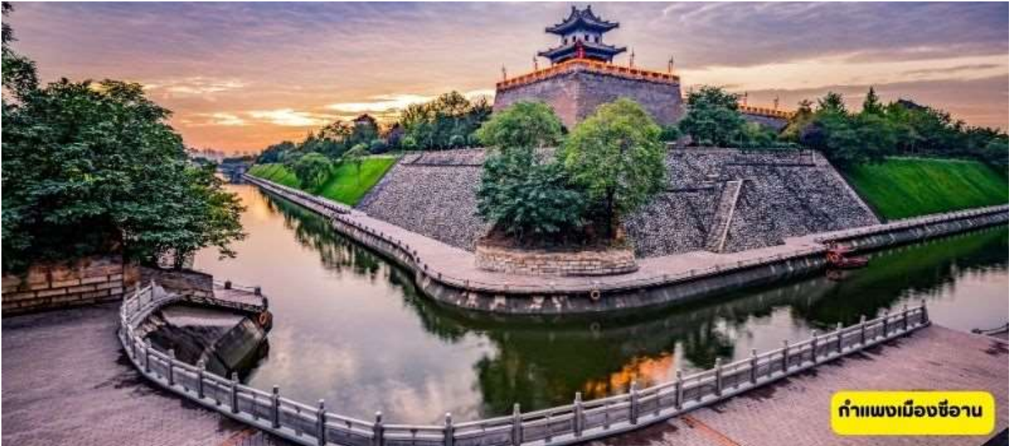
กำแพงเมืองซีอาน

นั่งรถไฟสู่เมืองซีอาน - วัดกว้างเหริน - กำแพงเมืองซีอาน - หอระฆัง - ถนนคนเดินมุสลิม