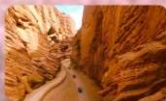
แกรนด์แคนยอนอาจูซือ