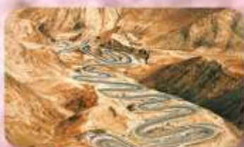
ถนนโบราณผืนหลงภูเขา