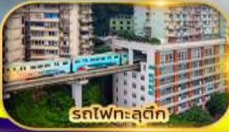
รถไฟเหาะลัดฟ้า