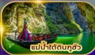
แม่น้ำใต้ดินกุ้อว