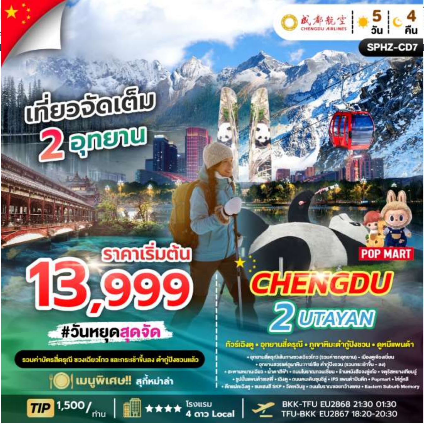
SPHZ-CD7 CHENGDU 2 UTAYAN- 5D4N เดินทางด้วยสายการบิน Chengdu Airlines (EU)