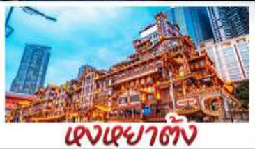
แสงเซาต้ง