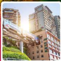
รถไฟฟ้าลัดติ๊ก