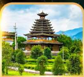
หมู่บ้านชนเผ่าตัง