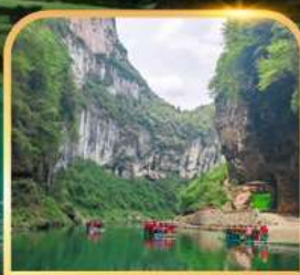
อุทยานจีนหลี่ซาน