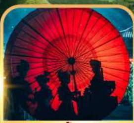
ชมแสงสีท่าเกิงหลง