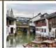
เมืองโบราณซูเจียเจียว