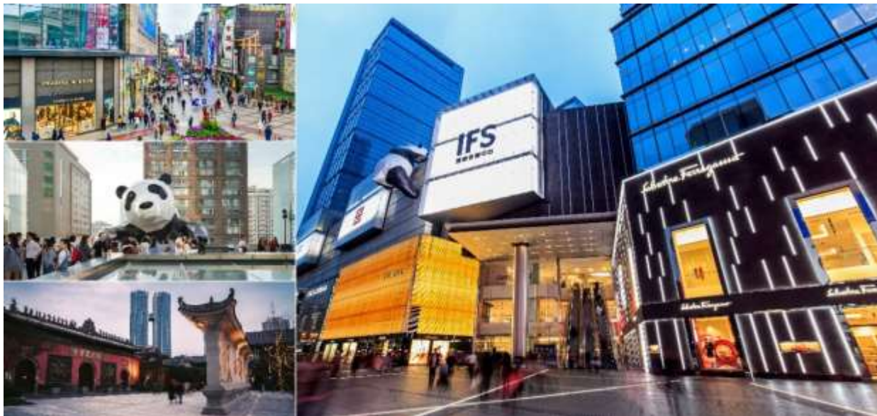
อิสระอาหารค่ำ ตามอัธยาศัย

ที่พัก HOLIDAY INN EXPRESS CHENGDU WUHOU หรือเทียบเท่า 4 ดาวจีน