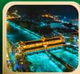
“สะพานหนานเฉียว น้ำตาสีฟ้า”