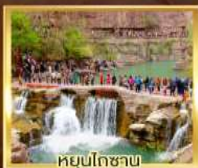
หยุ่นโกซาน