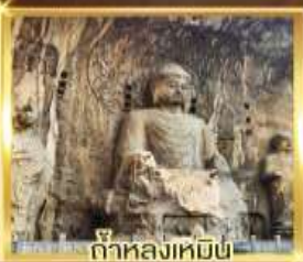
ถ้ำหลงเหมิน