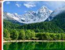
อุทยานπίงเิงโกว