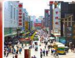
ช้อปปิ้งถนนคนเดินชุนซีลู่