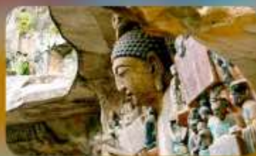
ฆาหินแกะสลักต้าจู้