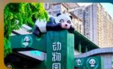
สถานีหมี่แพนต้า