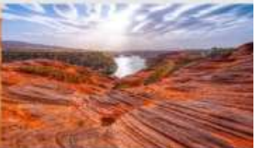
อุทยานหุบเขาคีลิน

*ทางบริษัทฯ ขอสงวนสิทธิ์ในการสืบโปรแกรมทัวร์ตามความเหมาะสมขึ้นอยู่กับสถานการณ์ทำงาน โดยค่าเดินทางผลประโยชน์ของลูกค้าเป็นสำคัญ