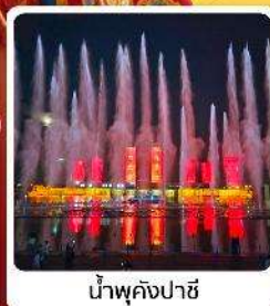
น้ำพุคังปาซี

● ไอลัก เป็นทราseyเสียงชาวมองโกลแห่งท้องถิ่นระดับ 5A ของจีน ภูเขาไฟอูลันฮาตา น้ำพุคังปาซี น้ำพุที่สูงที่สุดในเอเชีย