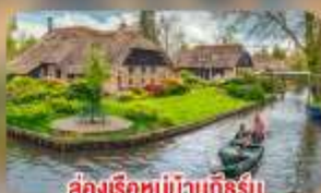
สองเรือหมู่บ้านทึร์น