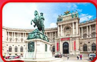
พระราชวังฮอฟบวร์ก