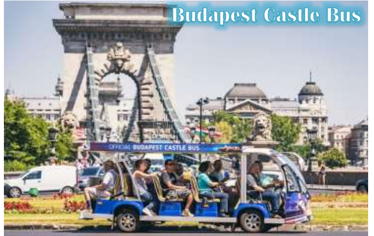
Budapest Castle Bus

บูดา Castle Hill *เนื่องจากตัวปราสาทตั้งอยู่บนเนินเขา การเดินทางโดยรถไฟไฟฟ้า จะเพิ่มความสะดวกสบายให้กับท่าน โดยรถไฟไฟฟ้าจะจอดรับและส่งตามจุดต่างๆ ในย่านเมืองเก่า ไม่ต้องเดินเท้าเป็นระยะทางไกล* จากนั้นนำท่านเดินชมความงดงามของเมืองเก่ารอบๆปราสาทบูดา ที่เริ่มมีการก่อสร้างมาตั้งแต่ปี ค.ศ.1265 และต่อเติมปรับปรุงมาโดยตลอด จนกระทั่งปัจจุบัน โดยตัวอาคารในปัจจุบันเราจะเห็นเป็นสไตล์บาโรค ที่ดู