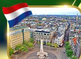
จัตุรัสดัมสแควร์ อัมสเตอร์ดัม