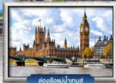
ล่องเรือแม่น้ำเทส