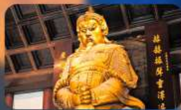
วัดเซ่งกงหมิว