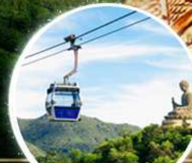
รวมกระเช้าฮ่องกง