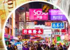
Shopping Taim Sha Tsui