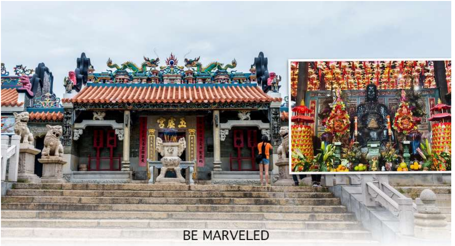
BE MARVELED วัดปักไต้