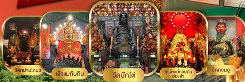
วัดหม่านโหมว

ไหว้พระเสริมดวงแบบจัดเต็ม รวมขึ้นพีคแกรม