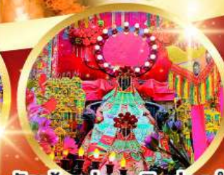
วัดเจ้าแม่กวนอิมฮองอ่า