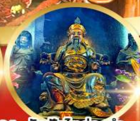
วัดปึกไคฮองอ่า