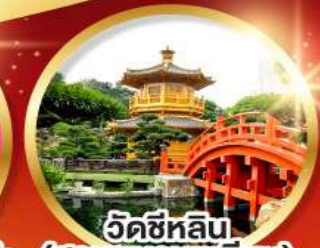
วัดซีหลิน