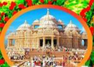
วิหารอินดูอัชฌาตัม