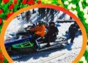
ขี่ SNOW MOBILE