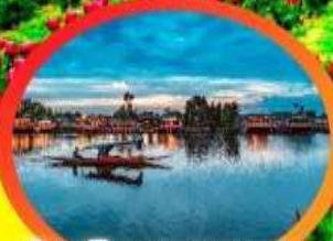
ล่องเรือทะเลสาบดาล