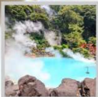
“BEPPU UMI JIGOKU”