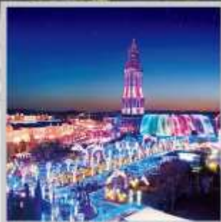
“HUIS TEN BOSCH”