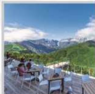
“HAKUBA MOUNTAIN HARBOR”

นำท่านไปโอบกอดธรรมชาติที่ครบครันในที่เดียว “คามิโคจิ” สวิสเซอร์แลนด์แดนญี่ปุ่นเทือกเขาที่ปกคลุมด้วยหิมะสวยงาม ชมความงามของ “ทุ่งพืชมอส ฟุจิชิบะซากุระ” มนต์เสน่ห์..พรมธรรมชาติสีชมพูหลากหลายสีสันสวยสดใส เปลี่ยนอริยาบท “ขึ้นกระเช้าฮาคุบะ อิวะตะเกะ” เพื่อชมวิวพาโนรามาของเทือกเขาแอลป์ญี่ปุ่นกันให้อิ่มใจ สัมผัสกลิ่นอายเมืองเก่า “เมืองทาคายาม่า” ที่ยังคงอนุรักษ์ความเป็นอยู่ เมื่อสมัยเอโดะกว่า 300 ปี สายช้อปปิ้งห้ามพลาด “คารุอิซาวะ เอ้าท์เล็ต” แลนด์มาร์กของเมืองคารุอิซาวะ และ “ย่านชินจุกุ” แห่งเมืองโตเกียว ชมความงามกับเส้นทาง “เจแปนแอลป์ (ท่าแพงหิมะ)” สุดยอดของการท่องเที่ยวที่ถูกขนานนามว่า “หลังคาแห่งญี่ปุ่น”