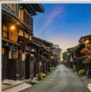
“TAKAYAMA OLD TOWN”