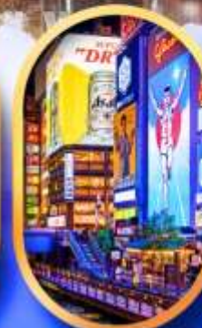
ย่านชิบะโฮนาชิ