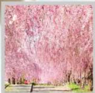
"NICCHUSEN WEEPING SAKURA"