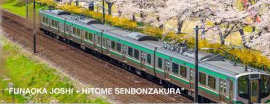
"FUNAOKA JOSHI + HITOME SENBONZAKURA"