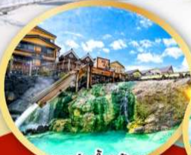
ชมบ่อน้ำพุร้อน ยูบาคาเกะ