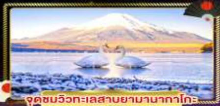
จุดชมวิวกะเลสาบยามานากาโกะ