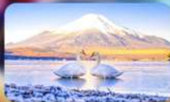
จุดชมวิวกะเลสายามานากาโกะ