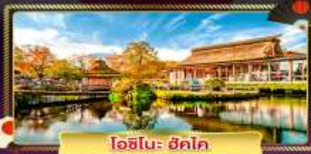
ไอชิโนะ ฮิโตะ