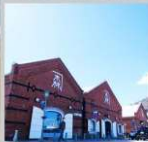
"KANEMORI RED BRICK"