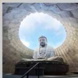
"HILL OF BUDDHA"