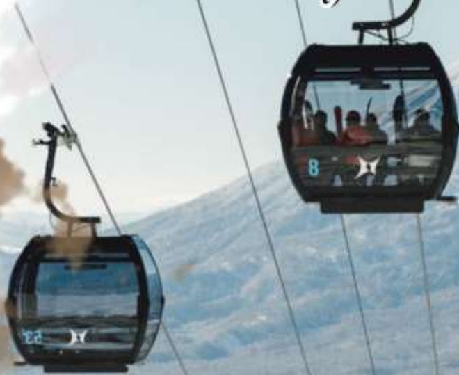
NISEKO ACE GONDOLA