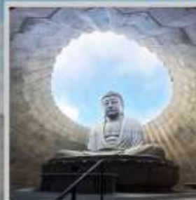
"HILL OF BUDDHA"