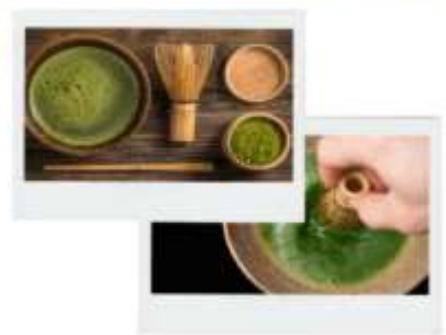
รูปภาพไฮไลท์ประกอบการโฆษณาเท่านั้น