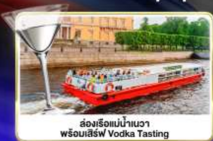
ล่องเรือแม่น้ำแคว พร้อมเสิร์ฟ Vodka Tasting