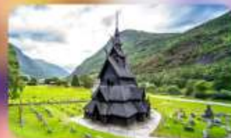
Unseen ไนท์ Borgund Stave Church