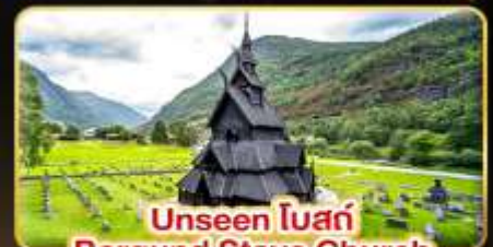
Unseen โบสถ์ Borgund Stave Church