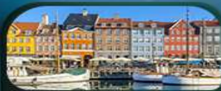
ย่านนูฮาวน์