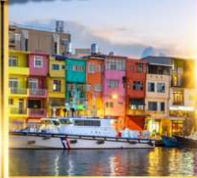
ท่าเรือประมงเจิ้งปิง