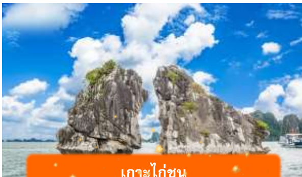
เกาะไก่อ๋น

เที่ยง บริการอาหารกลางวัน ณ ภัตตาคาร พิเศษ ... เมนูซีฟู้ดบนเรือ