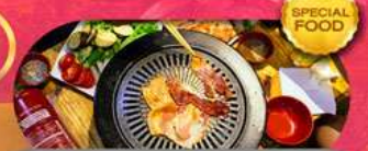
พิเศษเมนู BBQ Buffet เดินทาง มี.ค. - ต.ค. 69