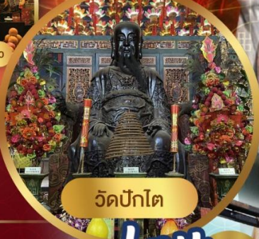
วัดปักโต