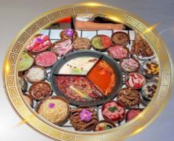
บุฟเฟ่ต์มือโหลงซิ่ง