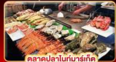
ตลาดปลาไถ่มาร์เก็ต